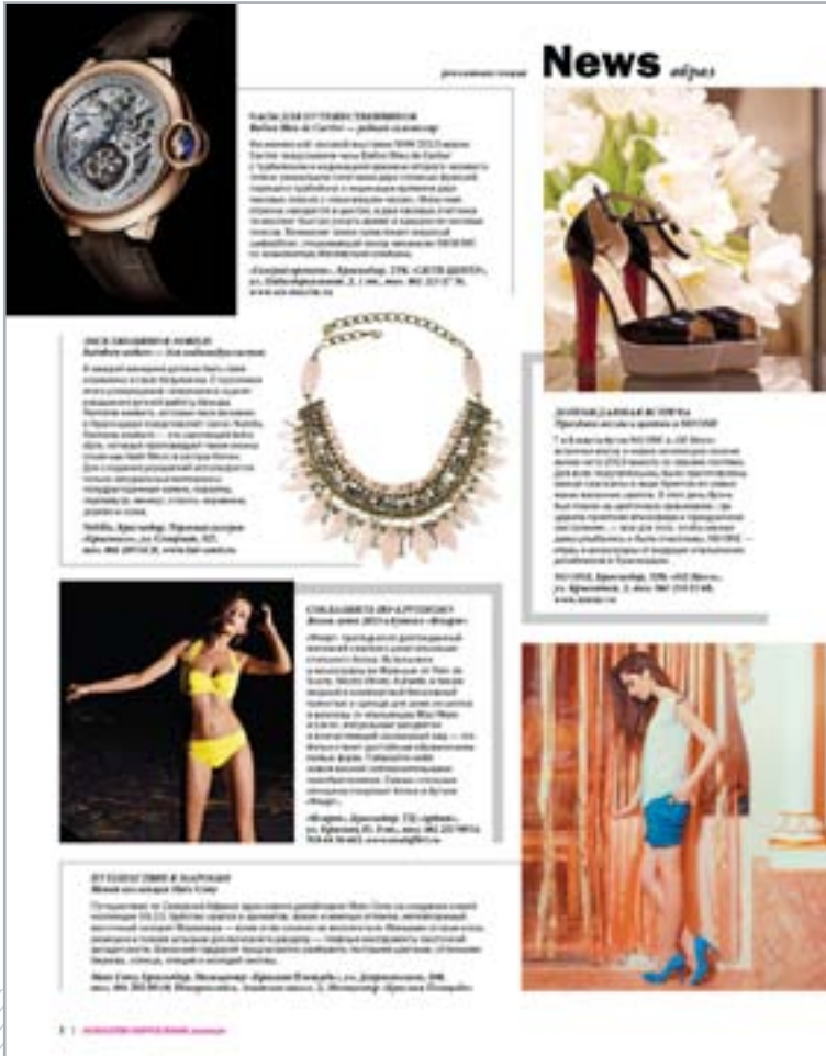
В рубрике образ