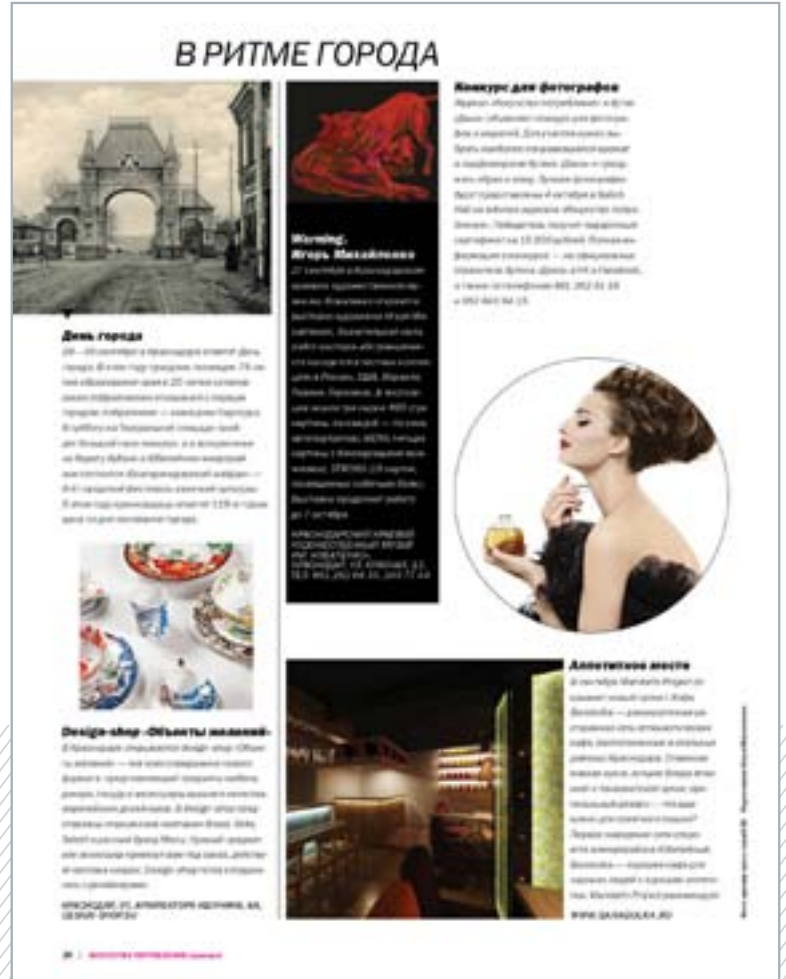
В ритме города