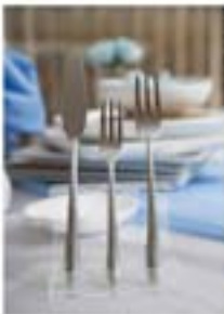
Для профессионального дизайна важно использовать качественные материалы, подобрать оптимальные решения

Сначала же предприниматель должен определиться с тем, что именно он хочет получить в итоге. Каждый бизнес имеет свои особенности. Например, в сфере общественного питания, где важно иметь качественное оборудование, текстиль, посуду, мебель и т.д. Владельцу необходимо учитывать все нюансы, связанные с оборудованием, мебелью, посудой и текстилем. Владельцу необходимо учитывать все нюансы, связанные с оборудованием, мебелью, посудой и текстилем. Владельцу необходимо учитывать все нюансы, связанные с оборудованием, мебелью, посудой и текстилем.