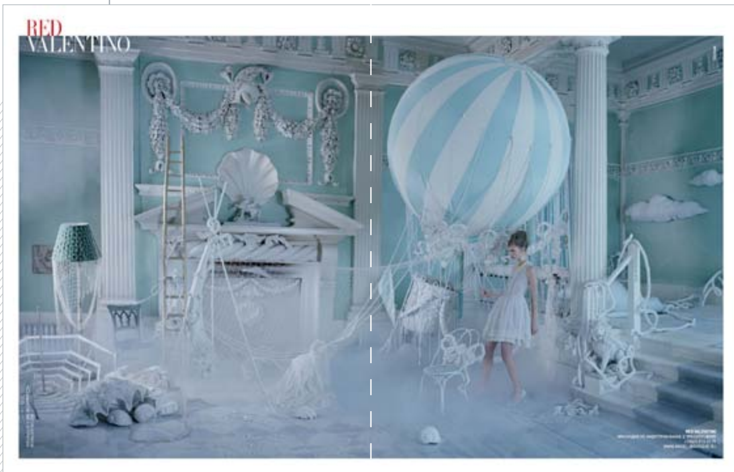
Модуль на разворот