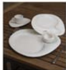
Для оборудования важно выбрать качественные материалы, подобрать стиль и цвет, учесть все нюансы

Для профессионального дизайна важно использовать качественные материалы, подобрать стиль и цвет, учесть все нюансы. Это может быть кафе, бар, ресторан, отель, магазин.