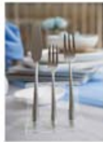
Для профессионального дизайна важно использовать качественные материалы, подобрать стиль и цвет, учесть все нюансы